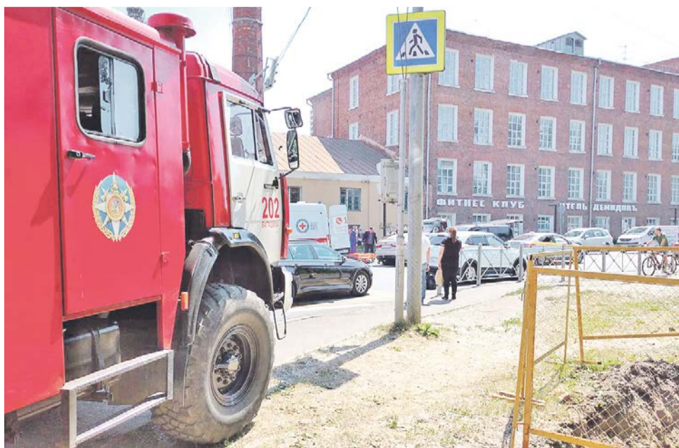
Фото из архивов территориальных управлений