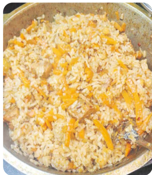
ПЛОВ С НУТОМ