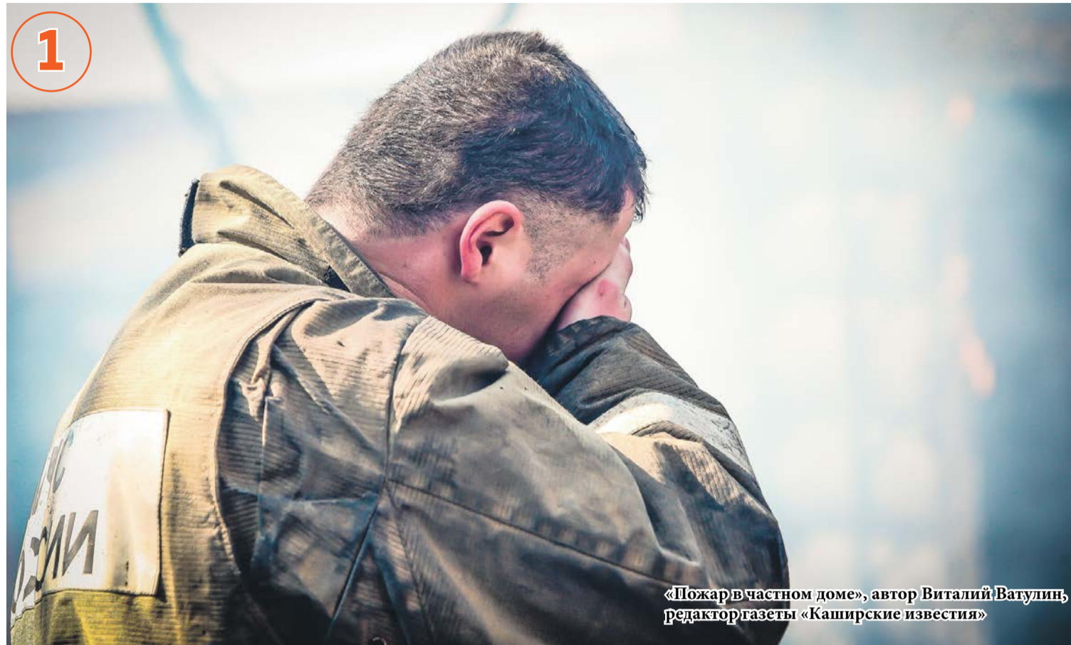
«Пожар в частном доме», автор Виталий Ватулин, редактор газеты «Каширские известия»