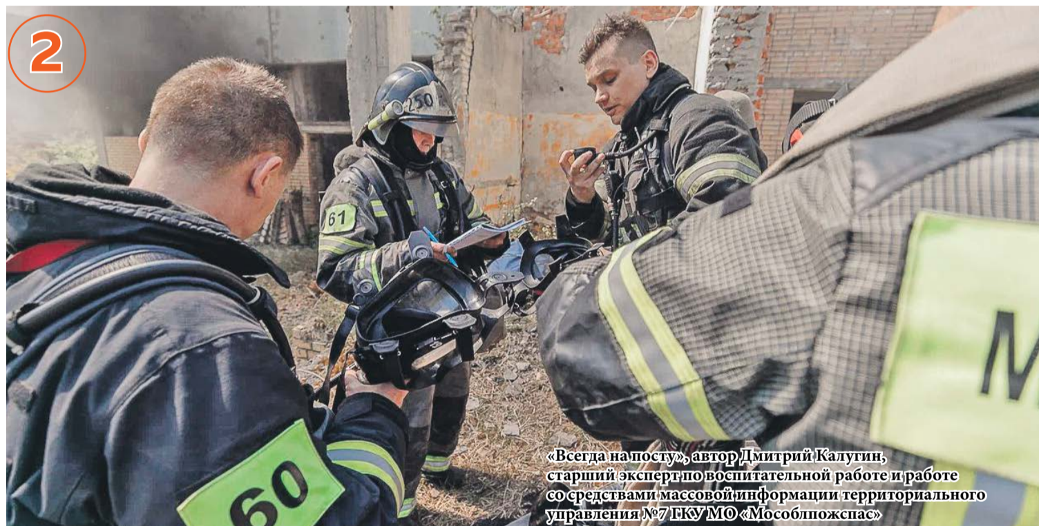
«Всегда на посту», автор Дмитрий Калугин, старший эксперт по воспитательной работе и работе со средствами массовой информации территориального управления №7 ГКУ МО «Мособлпожспас»