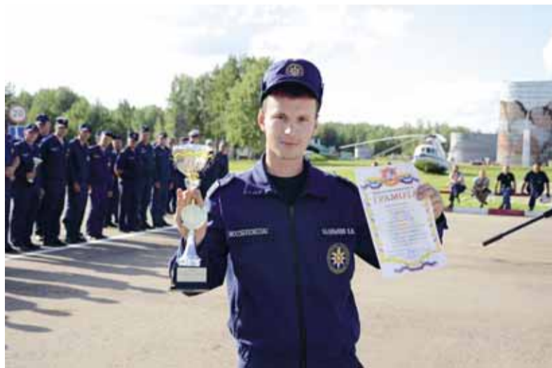
Пятиборье спасателей. 2013 год

и жизненного. И когда мы заступали на дежурство, – а спасатели частенько выезжают отдельно от пожарных, – была уверенность, что с ними все будет хорошо, они всё сделают, как надо.