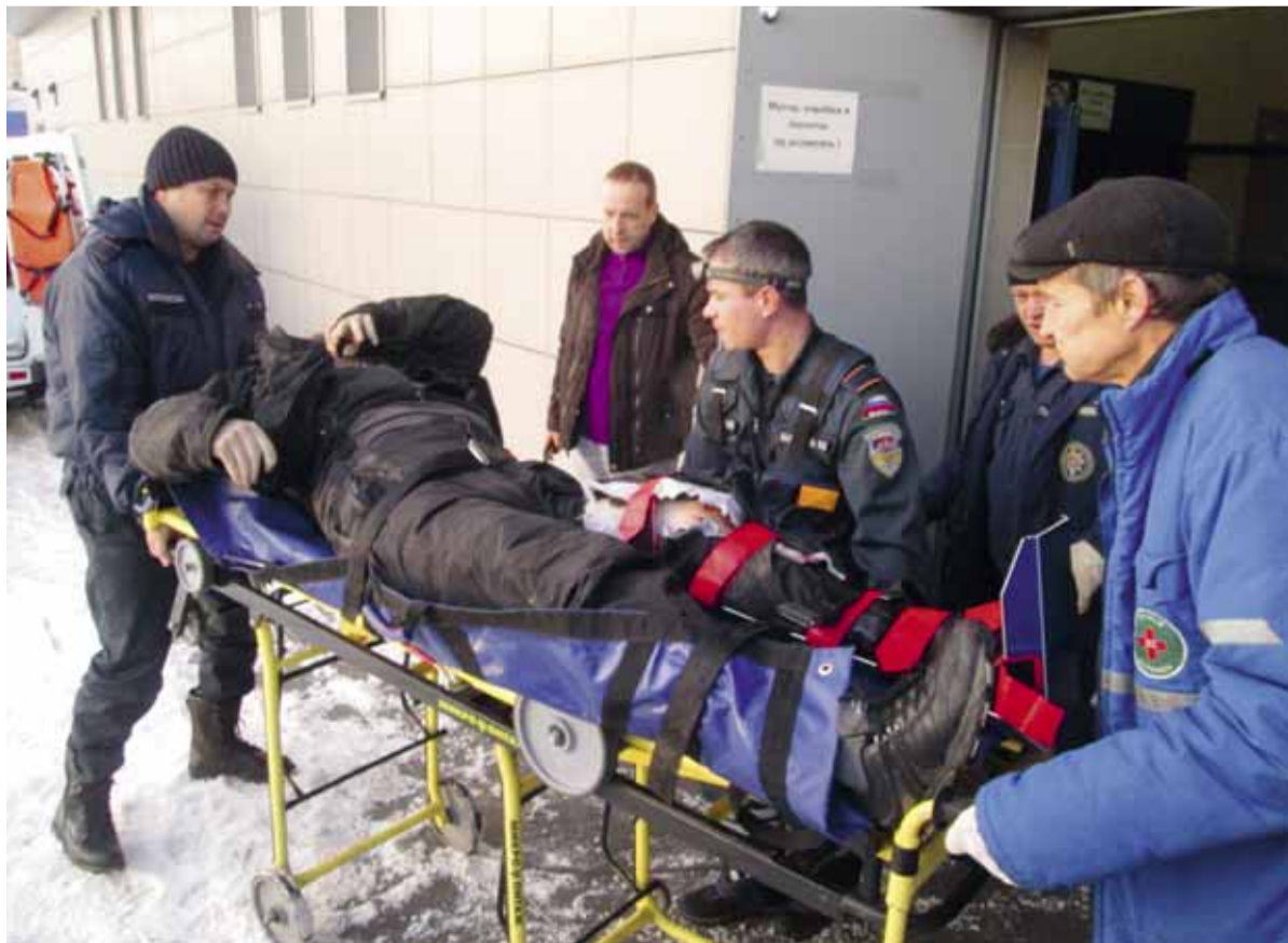
Спасение человека, упавшего в шахту лифта в ТЦ «Колесо» г.о. Балашиха. 2015 г.

Олег энергичный был человек. Задор в нем был, такая искорка. Вечерами на сутках, когда появлялось свободное время, мы общались. Так совпало, что когда-то он служил в Ногинском спасательном центре по контракту, а я позже служил там срочную. У нас было много общих тем для разговора. Обсуждали с ним отцовские вопросы: у меня год