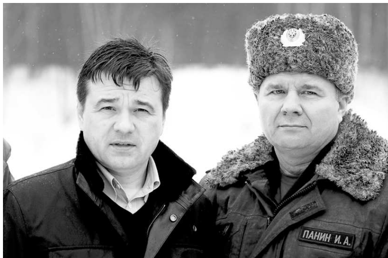
Перед совещанием врио губернатора Московской области А. Воробьев и начальник ГУ МЧС России по Московской области осмотрели спасательную технику и оборудование

«Мне очень приятно, что МЧС пользуется очень надёж-