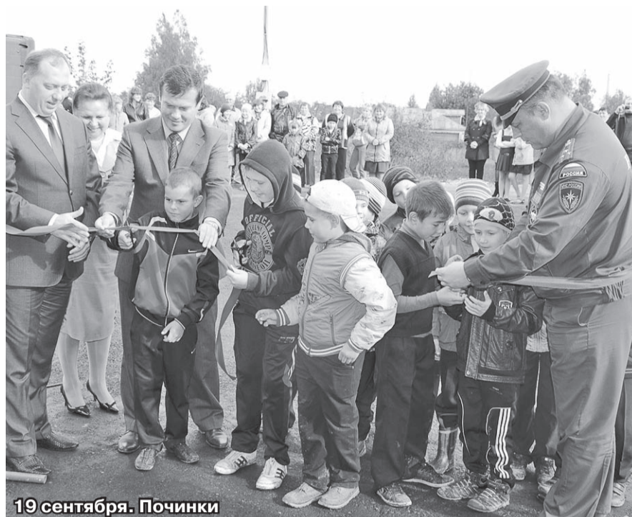
19 сентября. Починки

В ближайшее время планируется ввести в эксплуатацию еще четыре быстровозводимых модульных здания для добровольных пожарных команд - в Раменском, Чеховском и Егорьевском районах. Они уже построены. И еще шесть объектов на сегодняшний день находятся в стадии строительства. Они будут построены до конца текущего года. В четырех, расположенных на территории Шаховского, Павлово-Посадского, Дмитровского и Можайского районов, разместятся отдельные пожарно-спасательные посты для добровольцев. Объекты, строящиеся на территории Ногинского и Шатурского районов, предназначены для пожарных частей ГКУ МО «Мособлпожспас».