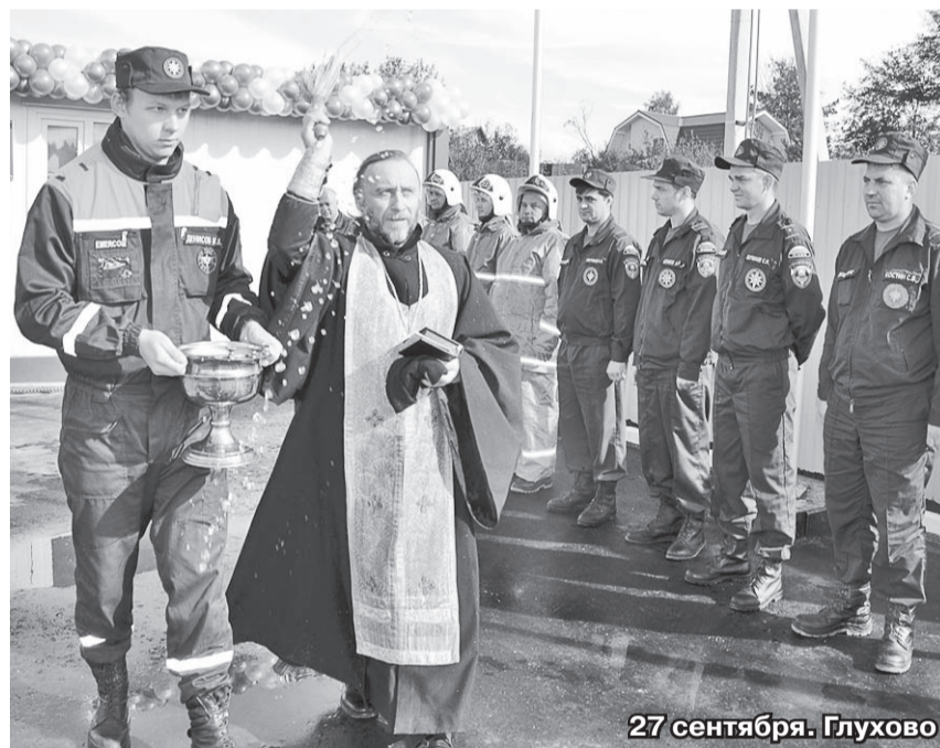
27 сентября. Глухово