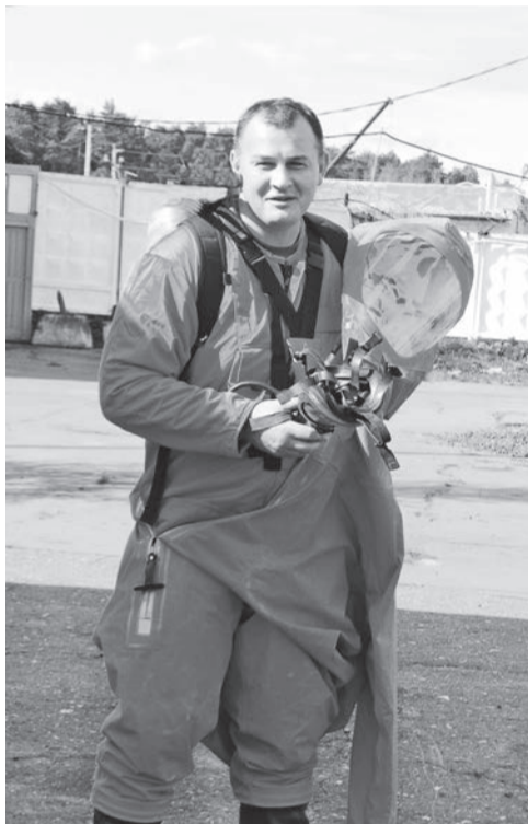
Специалисты химического отряда ГКУ МО «Мособлпожспас» осуществляют радиационное обследование

Дозиметрист — профессия, которую по праву можно назвать одной из самых ответственных и сложных. В недавнем прошлом специалисты такого профиля производили учет, хранение, обработку доз облучения персонала и населения, проживающего в зоне контроля. Сегодня их задачи расширились - они занимаются мониторингом окружающей среды, изучением промышленных и жилых объектов, выполняют измерения высокоинтенсивных полей радиации.