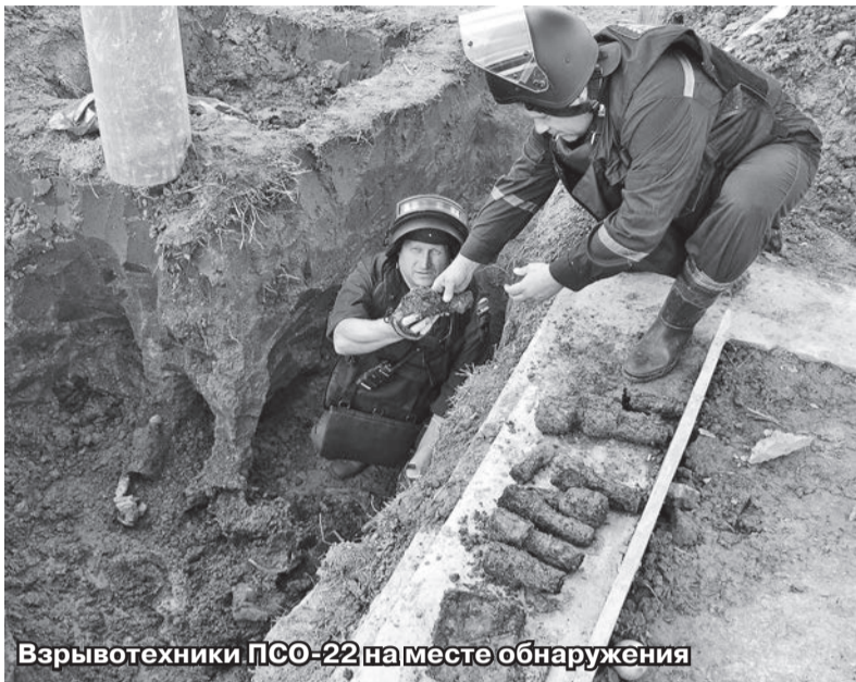
Взрывотехники ПСО-22 на месте обнаружения