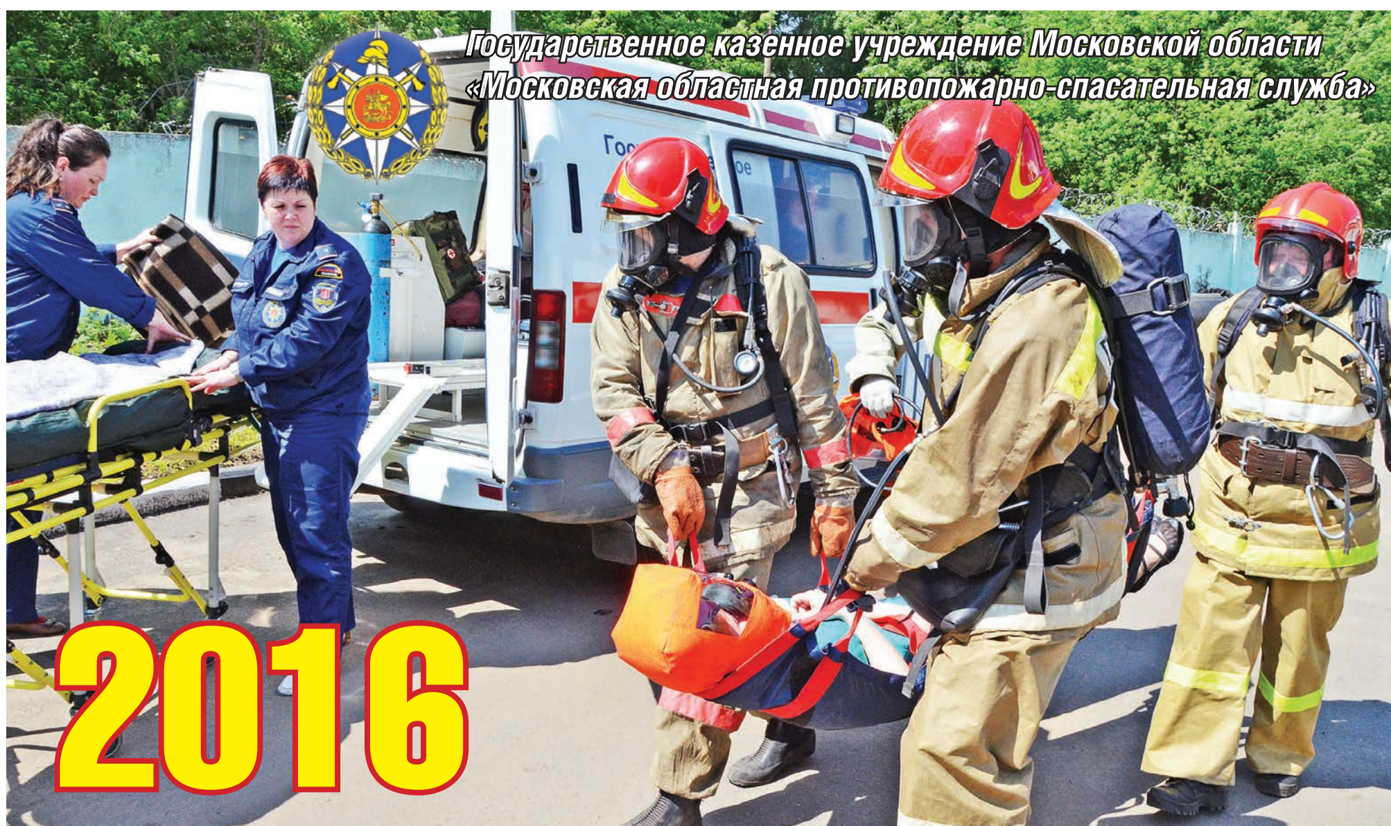
Государственное казенное учреждение Московской области «Московская областная противопожарно-спасательная служба»