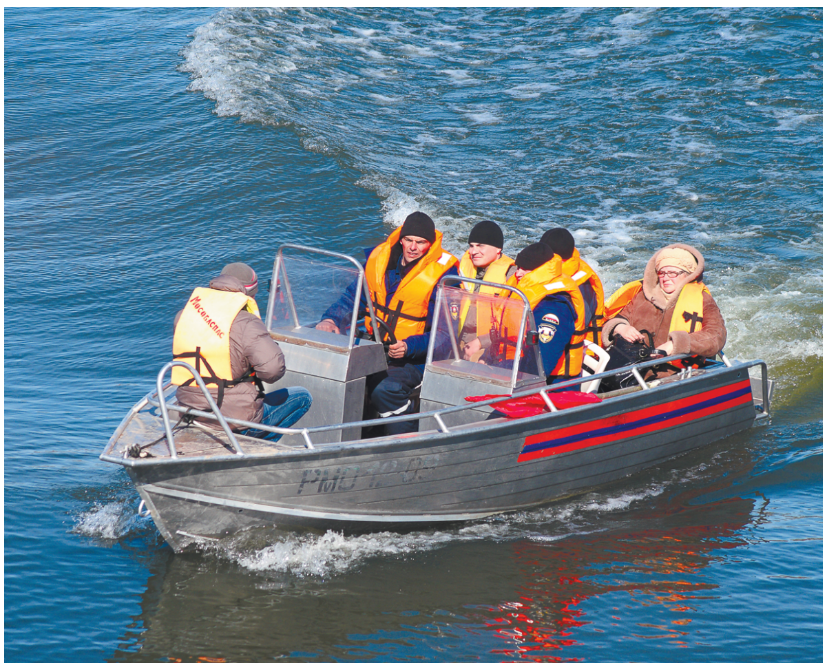
(Репортаж с учений читайте в следующем номере нашей газеты).

Таким был сценарий тактико-специального учения, прошедшего 5 апреля в Коломенском районе.